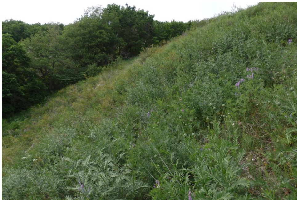
Рис. 5. Заросли василька русского ( Centaurea ruthenica Lam.) на юго-восточном склоне Куштау Fig. 5. Bed of Centaurea ruthenica Lam. on the southeastern slope of Kushtau

Шиханы Тратау и Юрактау являются памятниками природы республиканского значения [Уникальные ..., 2014; Реестр ..., 2016] и включены в качестве ключевых объектов в проектируемый в настоящее время геопарк ЮНЕСКО «Торатау» [Создание геопарка..., 2018]. Однако шихан Куштау, несмотря на то, что составляет единый комплекс с другими шиханами, не вошел не только в состав геопарка, но и в принципе не имеет особо охраняемого статуса. Это обусловлено тем, что в его средней части функционирует горнолыжная трасса республиканского значения, а в его основании со времен СССР расположены базы отдыха. Если ограниченное использование шихана под рекреационные нужды не приносит катастрофических последствий для природных комплексов шихана (хотя повышает число рудеральных видов в сообществах), то планы по его промышленной разработке в ближайшие годы для нужд содового производства ставят на грань полного уничтожения этот природный объект. Подчеркнем, также, что самый высокий шихан – Шахтау, на котором присутствовали уникальные природные комплексы, в том числе и отсутствующие на оставшихся шиханах [Уникальные ..., 2014], уже полностью разработан.