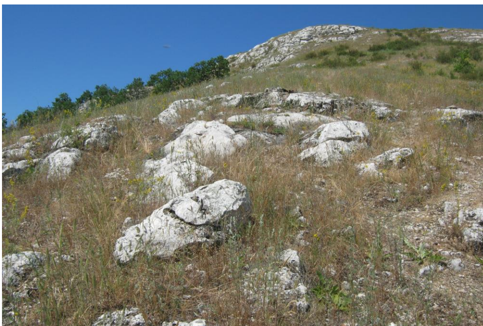
Рис. 4. Петрофитные степи южного склона Куштау Fig. 4. Stony steppes of the southern slope of Kushtau