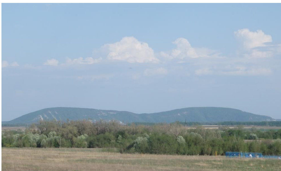
Рис. 1. Шихан Куштау (общий вид с западной стороны) Fig. 1. Shikhan Kushtau (general view from the western side)

Куштау – самый обширный по площади и наиболее облесенный шихан, имеет форму двугорбого хребта (рис. 1 и 2). Его протяженность с севера на юг 4 км, с запада на восток – 1–1.4 км. Со стороны западного и южного склонов его огибает р. Белая. Координаты южной вершины Куштау – 53.69^{\circ} с. ш., 56.08^{\circ} в. д.