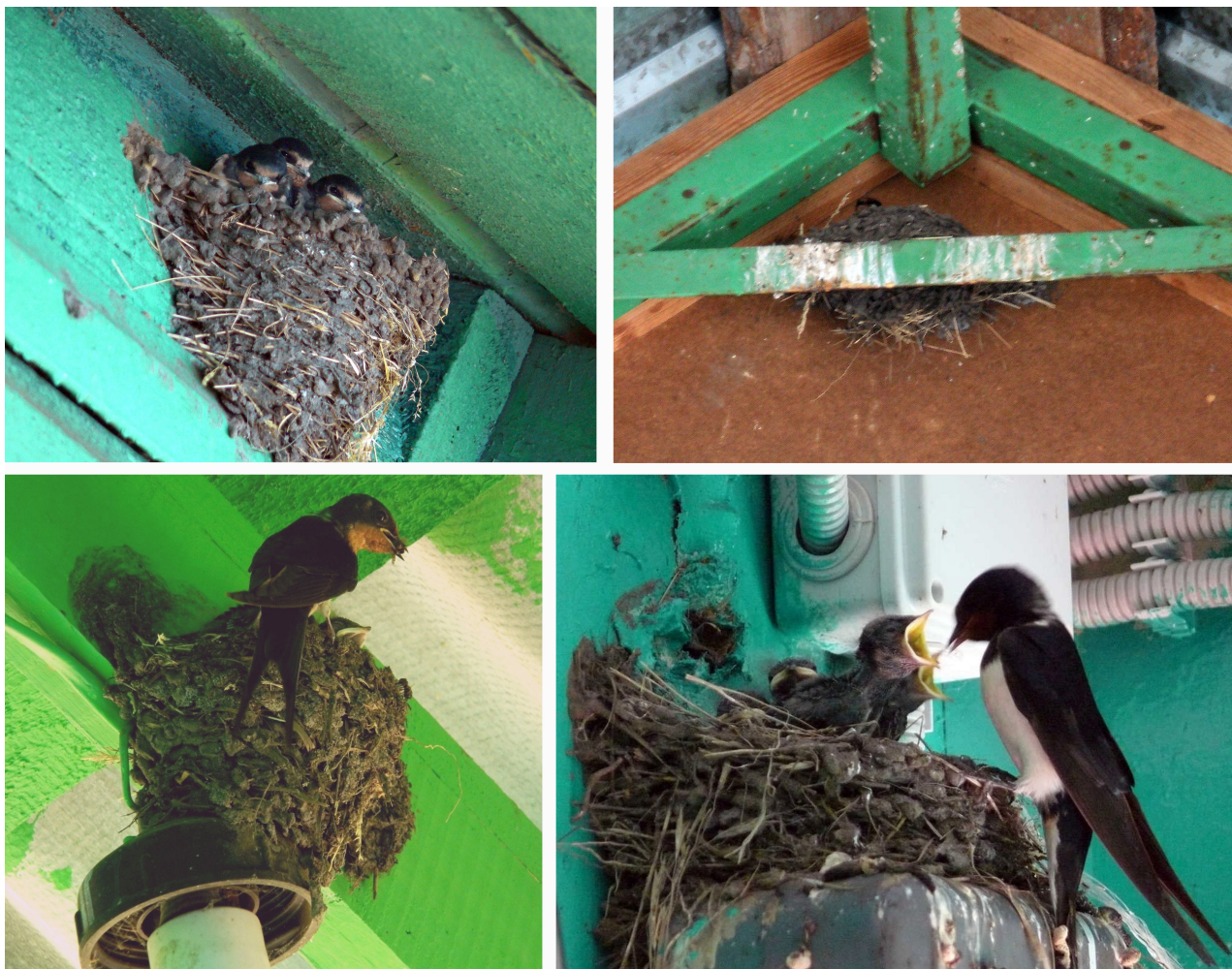
Рис. 2. Места устройства гнёзд деревенской ласточки ( Hirundo rustica L.) на территории Биологического учебно-научного центра Воронежского государственного университета (Новоусманский район, Воронежская область)