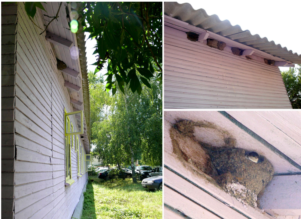
Рис. 3. Места устройства гнёзд воронка ( Delichon urbica (L.)) на территории Биологического учебно-научного центра Воронежского государственного университета (Новоусманский район, Воронежская область)

За период наблюдений на обследованной территории зарегистрировано 169 гнёзд воронка, в среднем ежегодно – 6,5. Размножение этих ласточек отмечено в течение 18 лет, в 1994–1995 гг. и 2000–2015 гг. Для постройки гнёзд на территории Биоцентра воронки использовали за все годы наблюдений 7 строений, что значительно менее разнообразно по сравнению с деревенской ласточкой. Более того, на четырёх зданиях гнёзда появлялись единично и только в годы повышения численности (см. рис. 1, №№ 10, 34, 37, металлический рупор рядом с № 75).