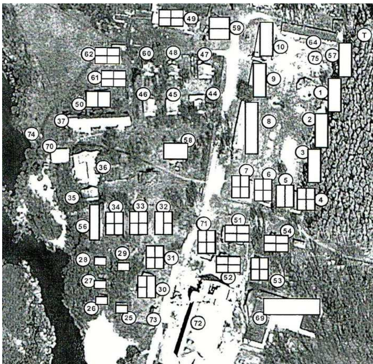
Рис. 1. Схема расположения строений на территории Биологического учебно-научного центра Воронежского государственного университета (Новоусманский район, Воронежская область) (пояснения см. в тексте)

Поскольку оба рассматриваемых нами вида ласточек устраивают гнёзда на постройках человека, кратко опишем историю существовавших и существующих в настоящее время строений на территории кордона.