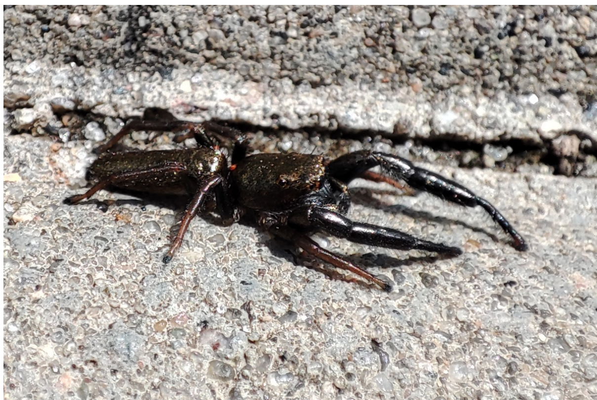
Рис. 1. Mendoza canestrinii (Ninni, 1868) ♂ на правом берегу реки Везёлки (г. Белгород), 18.06.2024