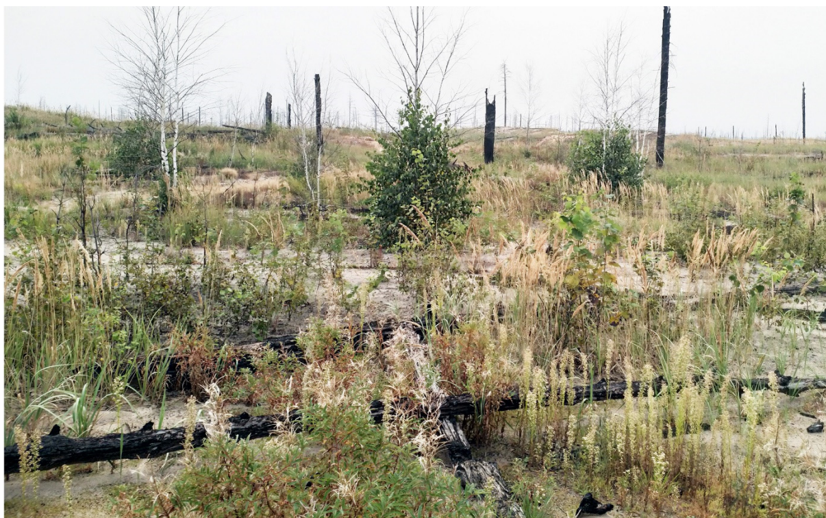
Рис. 2. Постпирогенный лишенный леса биотоп в Мордовском заповеднике, где была в 2023 году отмечена Chrysopa viridana Schneider, 1845 Fig. 2. The post-fire deforested biotope in the Mordovia Nature Reserve where Chrysopa viridana Schneider, 1845 was mentioned in 2023