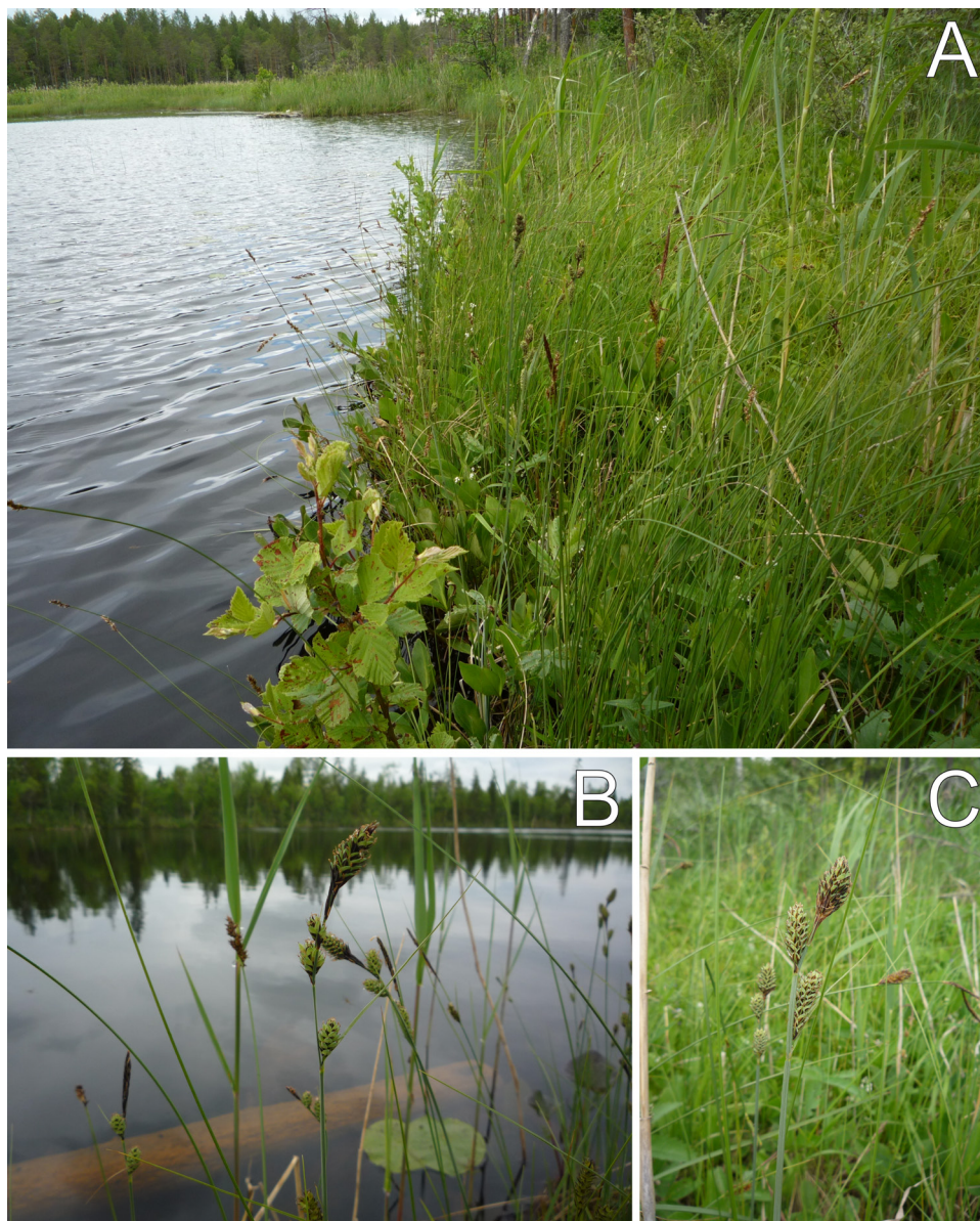
Рис. 2. Carex buxbaumii Wahlenb.:

А – болотное озеро как одно из характерных мест обитания (оз. Салозеро, 26.06.2018);