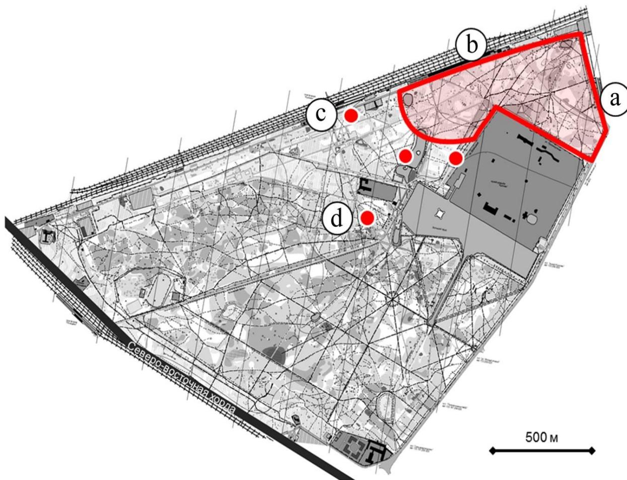
Рис. 2. Граница распространения испанского слизня Arion vulgaris в лесопарке «Кусково» на 2020 г. (сплошная красная линия) и его дальнейшее продвижение в 2021 г. (отдельные точки). Буквы в кружках показывают биотопы, фотографии которых даны на рис. 3 под теми же литерами Fig. 2. The distribution boundary of the Spanish slug Arion vulgaris in the Kuskovo forest park for 2020 (solid red line) and its further advancement in 2021 (separate points). The letters in the circles show biotopes, photos of which are given in Fig. 3 under the same letters

В 2021 году территория, заселённая испанским слизнем, заметно увеличилась. На значительном удалении от первоначальной популяции зафиксированы 4 новые отдельные поселения A. vulgaris (см. рис. 2, 3). Они находились на расстоянии 50, 80, 240, 480 м от исходной популяции, зарегистрированной в 2020 году. Ближайшие к исходной популяции новые поселения ещё недостаточно многочисленны: в каждой найдено не более 5 особей. Новые поселения занимают площади до 10 м 2 . Лишь самое удалённое поселение более многочисленно и обширно. В нём на дороге и у столбов освещения ночью найдено 30 особей на площади не менее 30 м 2 (см. рис. 2 и 3d).